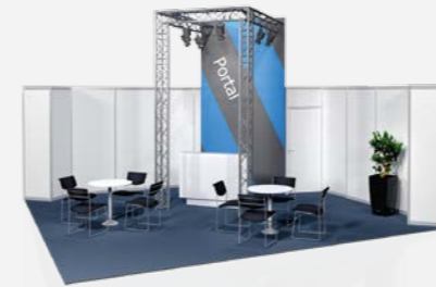
PORTAL ab 105,90 €/m 2 online konfigurierbar