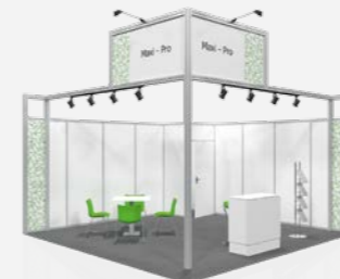
MAXI PRO ab 78,20 €/m 2 online konfigurierbar