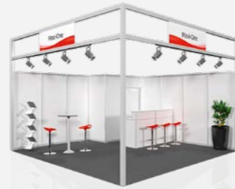
MAXI ONE ab 56,00 €/m 2 online konfigurierbar