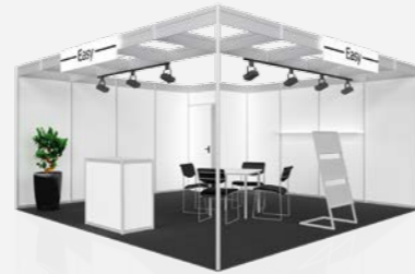
EASY ab 52,00 €/m 2 online konfigurierbar

Diese und über 100 weitere Standtypen können Sie online konfigurieren und direkt bestellen.