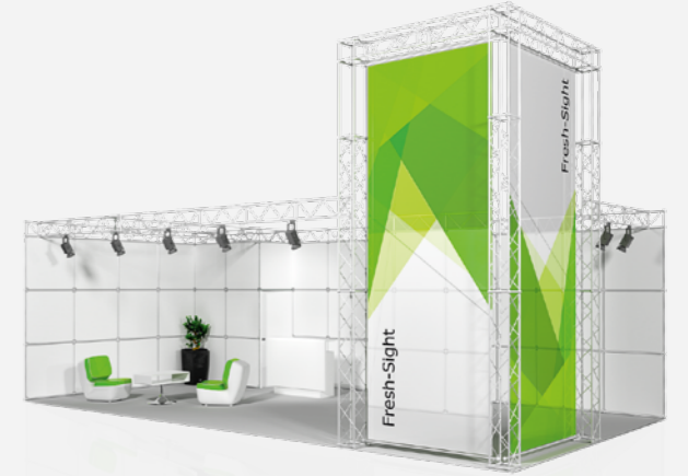
FRESH SIGHT ab 108,40 €/m 2 online konfigurierbar