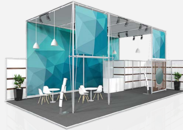
ALPHA ab 259,00 €/m 2 online konfigurierbar